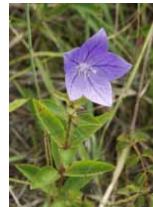
あさがお (キキョウ)