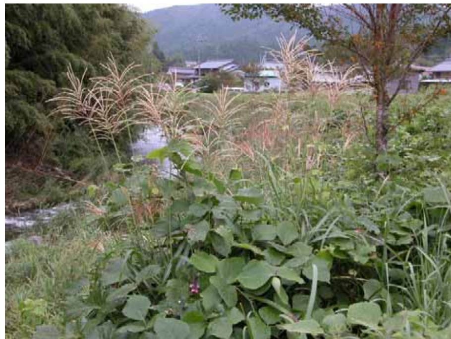
秋の七草の内の「おばな(ススキ)」と「くず」