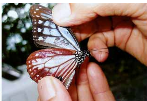
再捕獲されたアサギマダラ