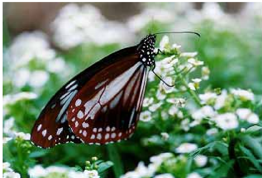
渡りをする蝶“アサギマダラ”