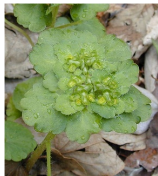
ヤマネコノメソウ