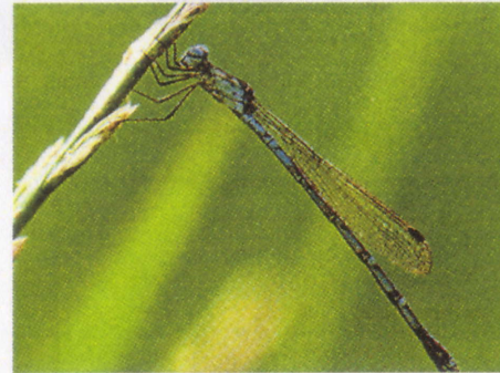
ホソミオツネトンボ