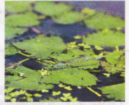
セスジイトトンボ