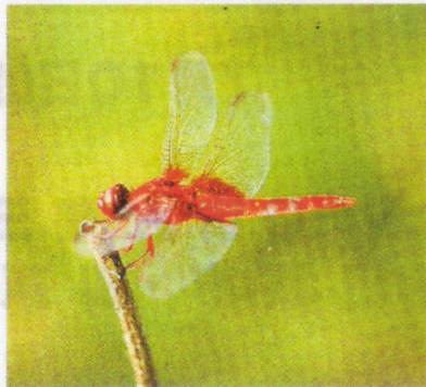
ショウジョウトンボ