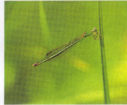
アジアイトトンボ