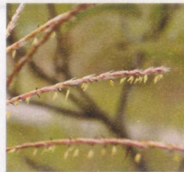
ススキと(上) ススキの花(左)