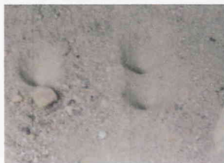
ウバカゲロウの幼虫