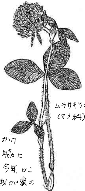
ムラサキツメクサ (マメ科)

梅雨入りが6月2日、明けが7月19日。しかし 梅雨明けとされる数日以上前から雨が降らない日々。 樹の葉がしおれ、葦毛湿原は更に乾燥気味に なるなど、心配になりました。去年ほどははやくも暑かったです。 8月下旬より雨が降るなどして、やや涼しく...。しかし28日 には豊橋に大雨が降り、冠水した道路も。 生物暦に大きな変化は無い模様。ワササやタカサゴ ユリは「夏休みの花」。セミについては「番外編」で!