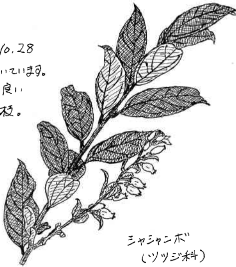
シャシャンボ (ツツジ科)