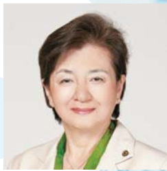
嘉田 由紀子(かだ ゆきこ) 滋賀県知事

第1部 ◆ポスターセッション 11:00～13:10 (愛知県・滋賀県NPO等の発表・交流)