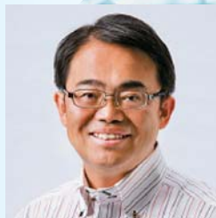
大村 秀章(おおむら ひであき) 愛知県知事

第2部 ◆あいさつ 13:20～13:30 ◆基調講演 13:30～14:10 「人々と共に歩む環境政策を目指して」 講師：滋賀県知事 嘉田 由紀子 ◆活動事例発表 14:10～14:50 愛知県NPO等：3団体 滋賀県NPO等：2団体