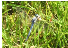
オオシオカラトンボ