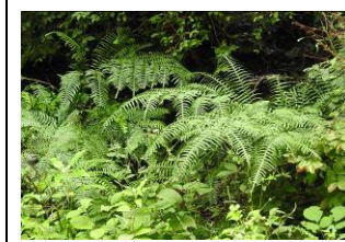
オオバノハチジョウシダ