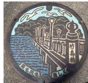
蒲郡市のマンホール