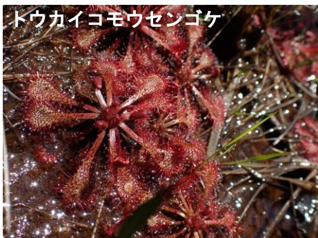
トウカイコモウセンゴケ