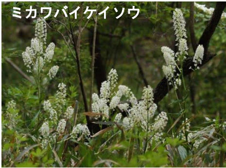
ミカワバイケイソウ