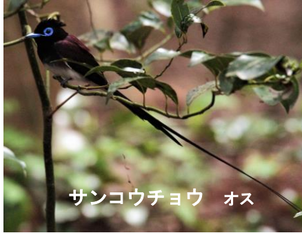
サンコウチョウ オス