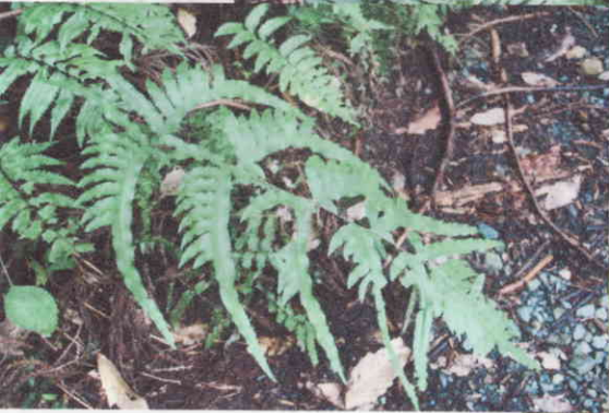
オハノアマサシダ