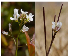
(タネツケバナ (左) と ミチタネツケバナ (右))