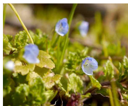
(オオイヌノフグリ)