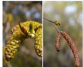
(オオバヤシャブシ (左) と ヒメヤシャブシ (右))